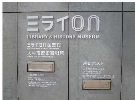
へんきやく 返却ポスト